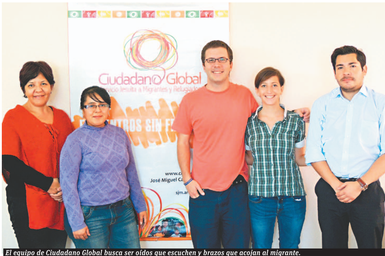
El equipo de Ciudadano Global busca ser oídos que escuchen y brazos que acojan al migrante.

estabilizan, consiguen contrato, carnet y ya no los vemos más. Pero la mayoría tiene trabajos informales y siempre vuelve”, asegura.