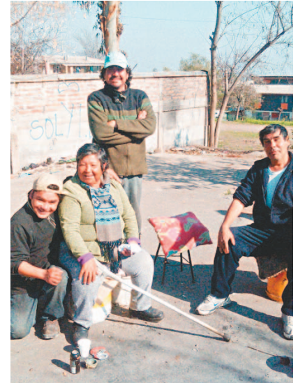
Para ser voluntario del programa se debe tener al menos 18 años.

Los voluntarios indirectos (colegios, comunidades católicas, instituciones), colaboran a través de campañas y aportes para