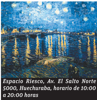
Espacio Riesco, Av. El Salto Norte 5000, Huechuraba, horario de 10:00 a 20:00 horas

Una experiencia multisensorial. Eso es lo que se experimenta al visitar la muestra audiovisual "Van Gogh Alive" que por estos días se está exhibiendo en el Espacio Riesco. Las composiciones más famosas del pintor holandés Vincent Van Gogh se proyectan en grandes pantallas de alta definición, paredes, columnas, techos, y hasta en el suelo, para que el visitante sienta que está sumergido en un mundo de sensaciones a través de la luz, el sonido y el movimiento.