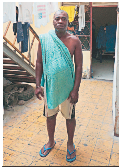
Colombianos buscan refugio en Chile.

dores extranjeros en empresas con más de 25 empleados, algo que termina por fomentar la ocupación sin contrato en sectores donde la mano de obra escasea. El sector minero, por ejemplo, según estimaciones del Gobierno, ofrecerá más de 70 mil empleos en los próximos ocho años.