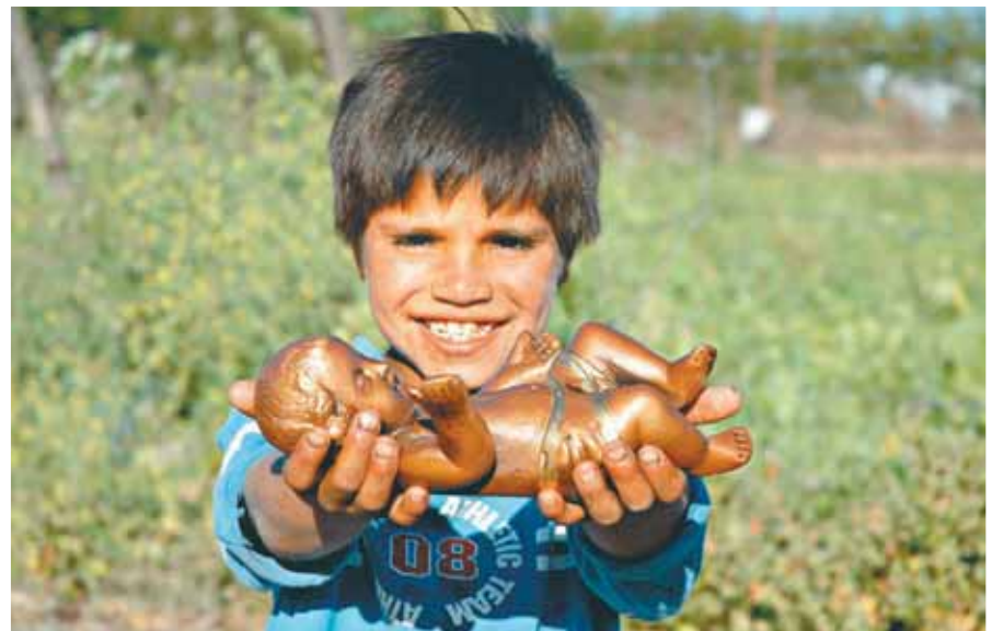
Sin el nacimiento de Jesús no tenemos cómo encontrarnos con Dios ni cómo llegar a la vida eterna.

Entrevistas completas en www.periodicoencuentro.cl