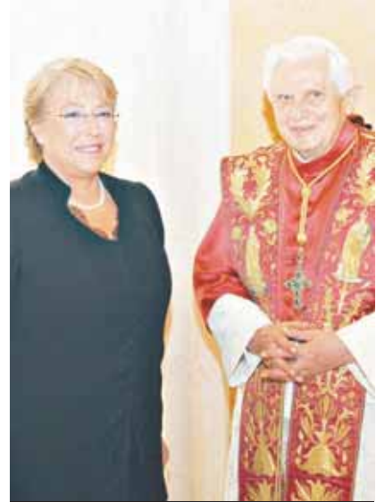
La presidenta Michelle Bachelet junto al Papa Benedicto XVI en su visita al Vaticano fines de noviembre.

"Este acontecimiento que hoy conmemoramos forma parte de la gran historia de dos nobles naciones, pero también de toda América Latina. El tratado de Paz y Amistad es un ejemplo luminoso de la fuerza del espíritu humano y de la voluntad de paz frente a la barbarie y la sinrazón de la violencia y la guerra como medio para resolver las diferencias", señaló Benedicto XVI a ambas mandatarias y sus delegaciones, reunidas en la Sala Clementina. "Dirijo mi mirada al Cristo de los Andes, en la cumbre de la Cordillera, y le pido que, con un don constante de su gracia, selle para siempre la paz y la amistad entre argentinos y chilenos", agregó el Santo Padre.