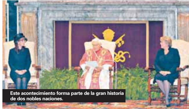
Este acontecimiento forma parte de la gran historia de dos nobles naciones.

La mandataria Bachelet, por su parte, expresó su gran alegría de poder celebrar los 25 años del histórico acuerdo alcanzado gracias a la Iglesia Católica, a la mediación de la Santa Sede, recordando también con cariño las figuras de Juan Pablo II y del Cardenal Samoré. "Hoy, señaló, a 25 años de la firma del Tratado de Paz y Amistad, podemos decir jubilosos, con seguridad y con alegría que la paz ha dado sus frutos y que los ha dado en abundancia y que nuestros pueblos viven muy contentos en esta atmósfera de concordia y de comprensión. Porque, no sólo nos quedamos con