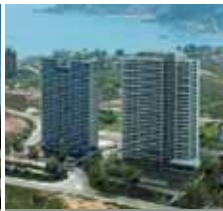
Viña del Mar